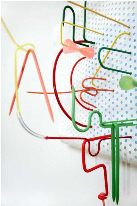
TH 2: Tamara Hauser, Futterwechseleinrichtung - Variationen und Etüden, 2013/14